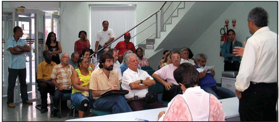
AGO também elegeu os novos membros, titulares e suplentes, do Conselho Fiscal da Coopsefes